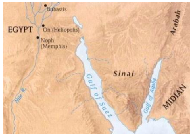
De locaties van de woestijn Sinaï en van Midjan, zoals tot voor kort vrij algemeen werd aangenomen.